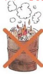
ドラム缶での野焼き