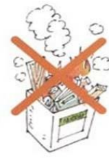
一斗缶での野焼き